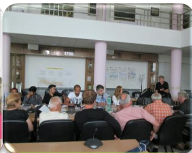
Radionice za vijeća i predstavnike nacionalnih manjina u Brodsko-posavskoj županiji