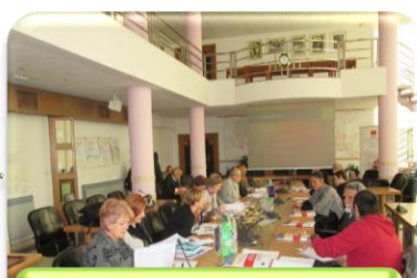
Izrada Akcijskog plana za Rome u Brodsko-posavskoj županiji