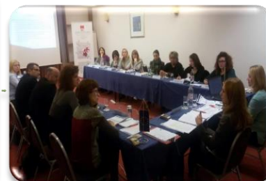
WeBLAN konferencija, 12.-14.10.2016. Zagreb