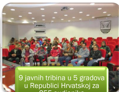
9 javnih tribina u 5 gradova u Republici Hrvatskoj za 255 sudionika