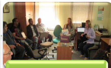
Izrada analize Ustavnog zakona o pravima nacionalnih manjina