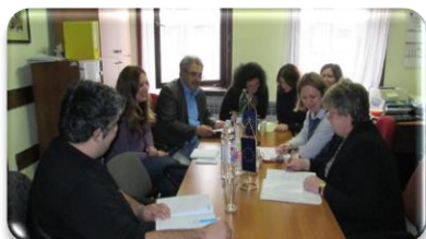
Sastanci mobilnih timova