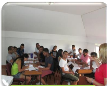
Radionice za predstavnike romskih udruga