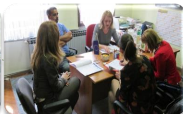
Sastanci projektnih partnera