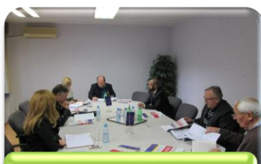
Uspostava Koordinacije vijeća i predstavnika nacionalnih manjina u Brodsko-posavskoj županiji